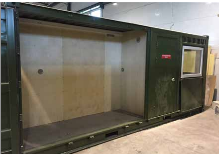
Standplass-container sett fra ene siden der visningsskjermene på 55 tommer for skyttere og publikum skal plasseres, skjermen for sol og regn.

4. Anvisning vil foregå live på en 55 tommer skjerm sentralt på skyteområdet. Her vil publikum kunne følge med skytterne underveis i seriene. Anvisningsskjermene plasseres slik at det ikke er mulig for skyttere å se sin egen serie fra standplass, og det vil heller ikke være tillatt med kommunikasjon mellom skyttere og publikum under seriene. Viser det seg at dette ikke overholdes vil anvisningen bli endret til lukket. Skytterne trekker etter endt skyting og gjennomført visitasjon over til anvisningsskjermen for å se sine resultater. Resultatet vil