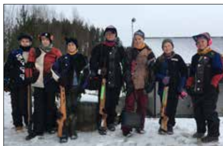
Spydebergs deltakere på samlagsstevnet finfelt.

2017 begynte med Follo i feltskyting, og første kamp gikk mot Moss og Våler. Den kampen ble skutt under Trøgstadstevnet. Der gikk vi som ventet på et tap. Veien videre gikk da til B-cup, en egen cup for de som taper første runde. Her ble det to strake seiere, hvor vi slo ut både Trøgstad og Ski 2 før det ble finale mot Aas. Der viste Aas seg litt for sterke for oss, og vant med 7 treff.