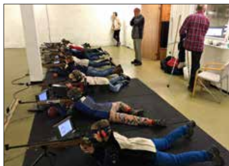
Aktiviteten inne i høst har vært bra.

Utvalget har nok en gang gjort en kjempeinnsats. Det har i 2015 vært avholdt 13 treningskvelder med muligheter for å ta storviltprøven. Treningsiveren blant jegerne er upåklagelig, og det rapporteres om større aktivitet i år enn tidligere. Mange av jegerne skyter langt mer enn de obligatoriske 30 treningsskuddene, noe som er veldig bra! Inntektene fra elgskytingene tilsier at dette er en veldig viktig del av arbeidet i skytterlaget.