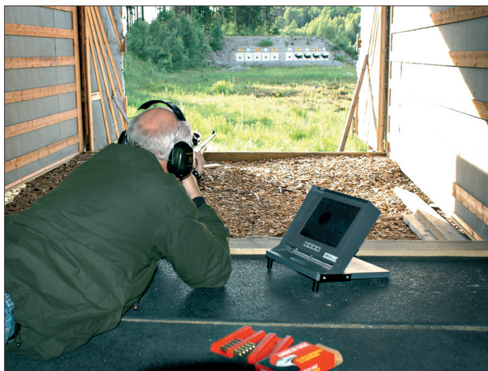
Elgskytinga på Sandem-banen fungerer veldig bra!

Utvalget har nok en gang gjort en kjempeinnsats. Vi har fått mange positive tilbakemeldinger fra jegere som har tatt storviltprøven hos oss. Det har vært avholdt 13 treningskvelder med muligheter for å ta storviltprøven. Inntektene fra elgskytingene tilsier at dette er en veldig viktig del av arbeidet i skytterlaget.