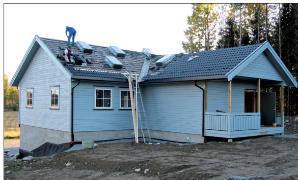
Skytterhuset pr. oktober 2007.

Arbeidet med nytt skytterhus går sakte men sikkert framover. Målet er å få huset ferdig utvendig før snøen kommer, og ferdig innvendig til vårt pinsesestevne i mai 2008. Med god dugnadsinnsats i høst og vinter burde vi klare det.