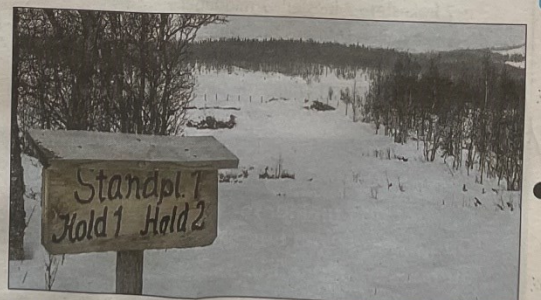
FELT: Det er også opplegg for terrengskyting, men det blir for tiden ikke brukt.