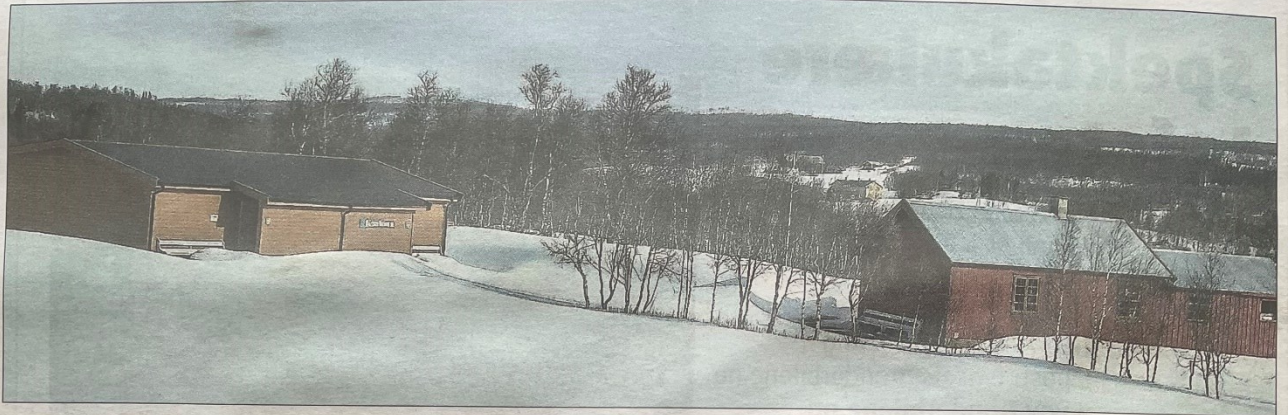
SKYTEBANE: Sentrale hus på skytebanen for Brekken/Aursund skytterlag. Til høyre er den påbygde/restaurerte tyskbrakka frå 1948 med kjøken/restaurant og lager. Til venstre standplass. I bakgrunnen kan ein sjå dei to gårdane «oppi Råen».